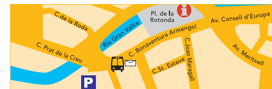
Andorra la Vella - La Sardana (La Poste) B