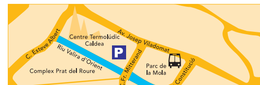
Escaldes-Engordany - Parc de la Mola (Caldea) B

Places limitades · Plazas limitadas · Capacité limitée · Limited inscriptions