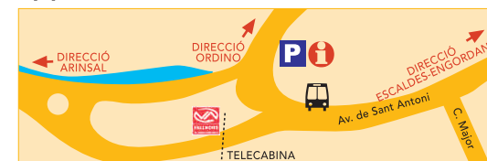
La Massana - Centre Vila B