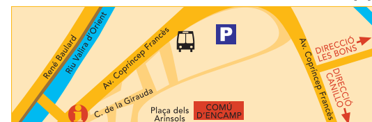
Encamp - Plaça dels Arinsols B