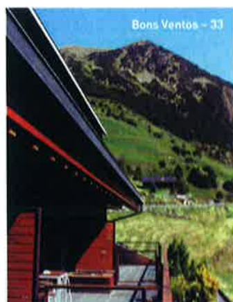
Bons Ventos - 33