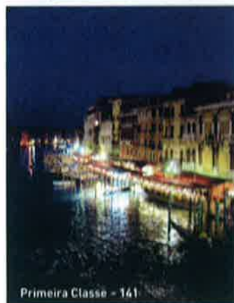
Primeira Classe - 141