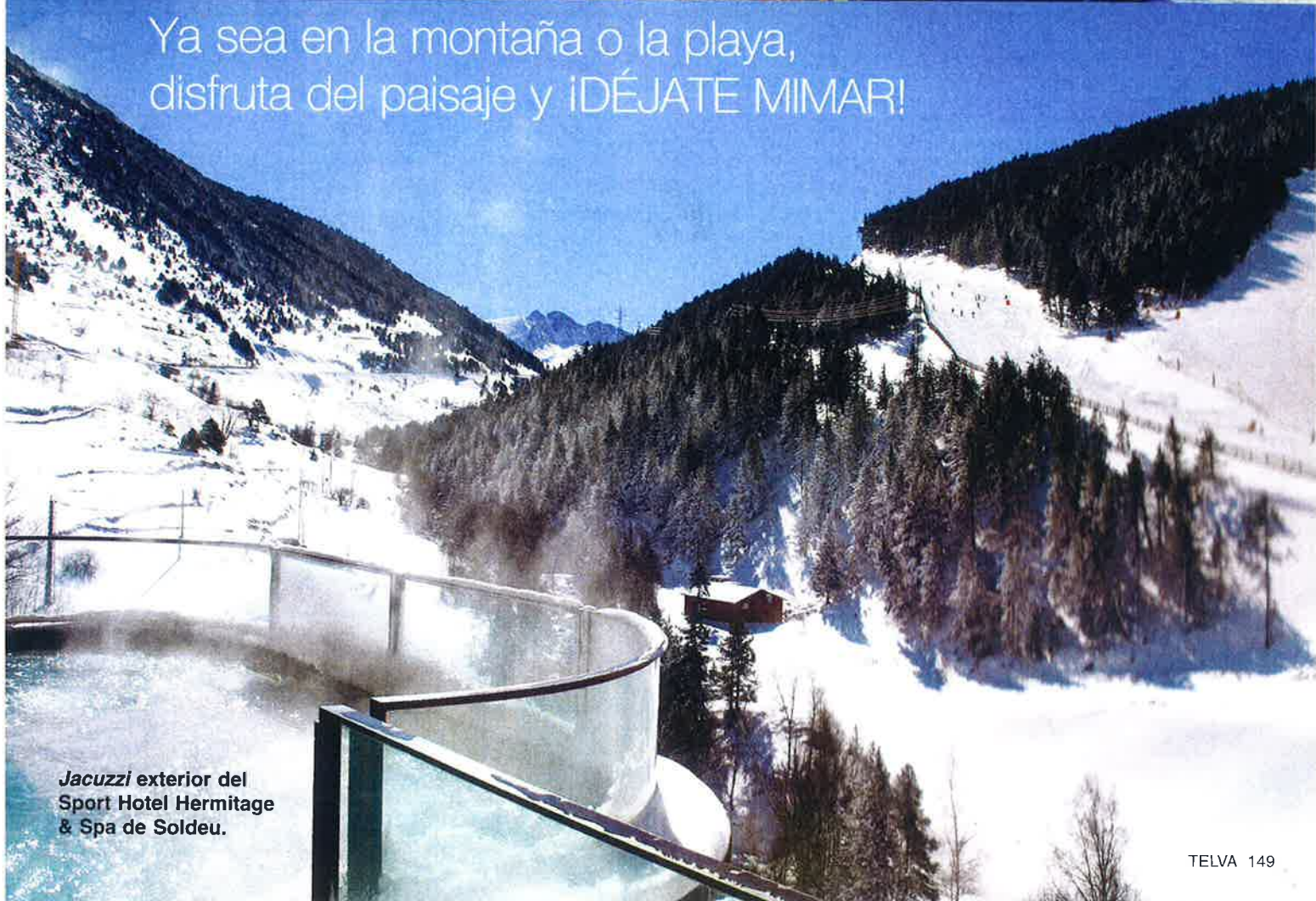
Jacuzzi exterior del Sport Hotel Hermitage & Spa de Soldeu.

Ya sea en la montaña o la playa, disfruta del paisaje y ¡DÉJATE MIMAR!