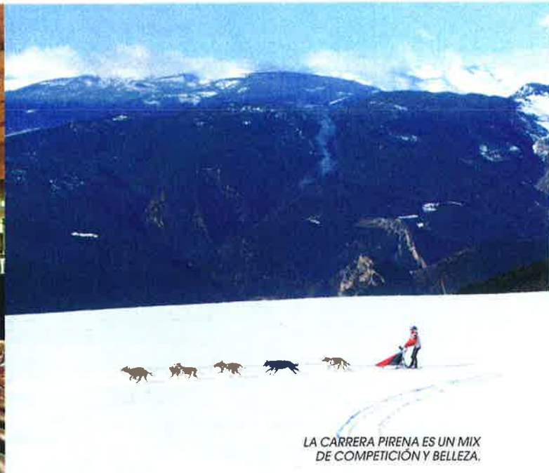
LA CARRERA PIRENA ES UN MIX DE COMPETICIÓN Y BELLEZA.