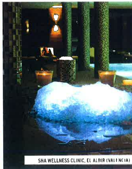
SHA WELLNESS CLINIC, EL ALBR (VALENCIA)