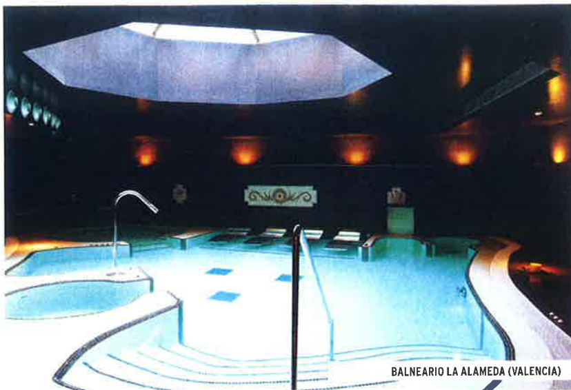
BALNEARIO LA ALAMEDA (VALENCIA)