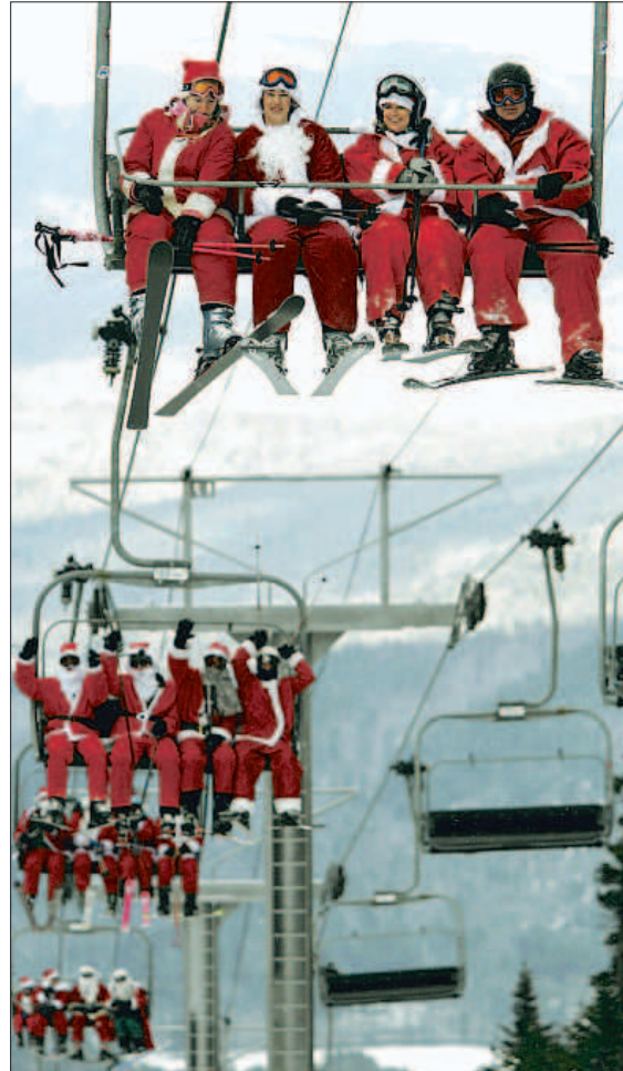
En Newry (Maine) 500 esquiadores tuvieron acceso gratis al vestirse de Papá Noel

El grupo Aramón engloba a las estaciones de Cerler, Formigal, Panticosa, Javalambre y Valdelinares, lo que supone la mayor superficie esquiabile de España, 269 kms. y 229 pistas. Cuenta con instalaciones de todos los niveles para todo tipo de esquiadores: 75 remontes con capacidad para