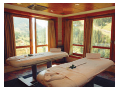
ENMIG DE LA NATURA

l'aigua és el mitjà natural de relaxació, no només a les piscines de l'Spa, sinó també en molts dels tractaments que es realitzen.